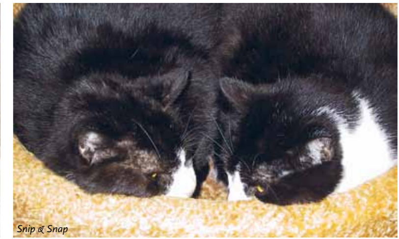
Snip & Snap