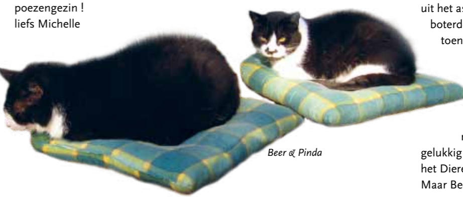
Beer & Pinda

Note van de Poezenboot: Snip en Snap zijn 2 grote, iets te dikke katers. Beide zijn in minder of meerdere maten chronische niezers. Dat maakte het plaatsen van deze oudere heren, toen al 10 jaar, erg moeilijk. Chronische niezers kunnen erge niesbuien hebben, dat kan vaak zijn maar ook alleen bij vlagen. We waren dan ook geweldig blij dat mevrouw Gera, in 2004, wel voor de beide heren viel en het niezen op de koop toenam. Inmiddels heeft Beer vorig jaar zijn 18e verjaardag gevierd.