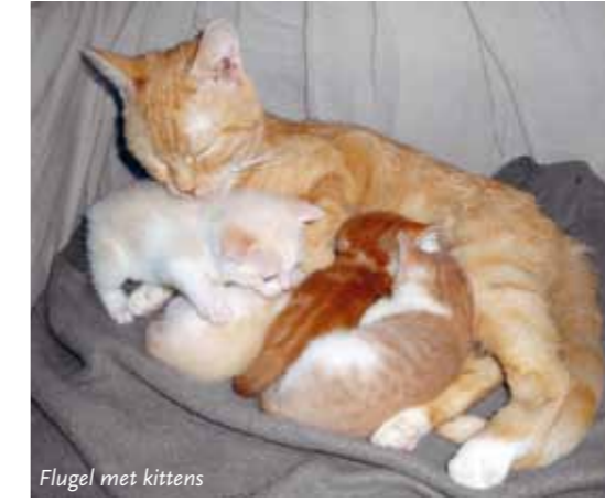
Flugel met kittens

eigenaar terug gegaan na te zijn gecastreerd of gesteriliseerd omdat ze extreem angstig waren, te angstig. Deze katten waren niet gesocialiseerd. Er zijn 2-3 katten die we, na de plaatsing, nog in de gaten houden ivm gezondheidsklachten. 2 katten zijn voor een hart echo naar de dierenarts geweest waarvan 1 wel en 1 geen hartprobleem bleek te hebben. Maar al met al hebben de katten zich heel goed gehouden en is de aanpassing, over het algemeen, toch vrij soepel verlopen.