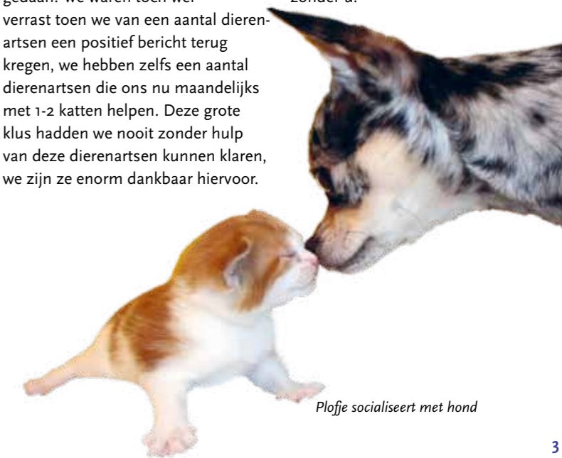
Ploffe socialiseert met hond

Ik wil graag alle nieuwe huisgenoten van deze katten heel erg bedanken voor hun hulp en het geduld dat ze hebben met hun nieuwe kattenmaatjes. Het is niet niets wat de katten hebben moeten doormaken en uw begeleiding en geduld is cruciaal. Van de meeste horen we zeer goede berichten, een paar katten moeten wennen aan hun nieuwe thuis maar we hebben er alle vertrouwen in dat ook deze katten zich helemaal thuis gaan voelen bij hun nieuwe huisgenoten en een prachtige toekomst tegemoet gaan.