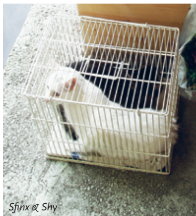
Sfinx & Shy

is er een zeer verontwaardigde brief onderweg naar deze mensen. Maar uit alle informatie die we hebben vergaard blijkt dat er niet veel tegen te doen is.