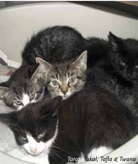
Taro, Takal, Tafla & Twana