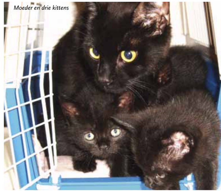
Moeder en drie kittens