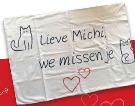
Dit hing buiten aan de boot

Michi, we missen je enorm. Het Poezenboot team