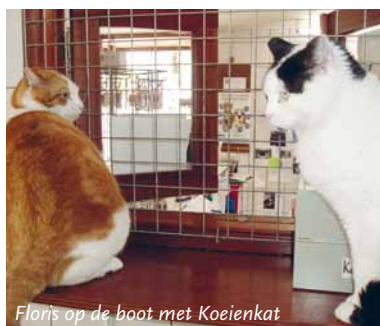
Floris op de boot met Koeienkat