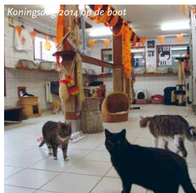
Koningsdag 2014 op de boot