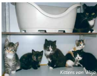
Kittens van Waja

We hebben een moeder met al grote kittens, die we een week na de vaccinatie al konden plaatsen, dus die zijn op de boot gebleven. Ook omdat ik dacht: daar vinden we snel leuke mensen voor, het is nl. een hele lieve, sociale en makkelijke moederpoes. Maar dat bleek anders, er kwamen met het mooie weer en misschien de naderende schoolvakantie bijna geen mensen die voor een kat kwamen kijken. Het is heel frustrerend en verdrietig als je zo'n moederpoes met kittens dan niet goed geplaatst krijgt. Ik weet zeker dat het gaat lukken maar het gaat me niet snel genoeg.