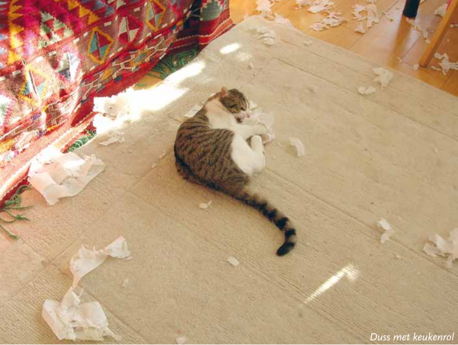
Duss met keukenrol