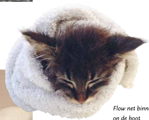
Flow net binnen op de boot

Als ik ze soms bang was dat de stoeipartij te wild werd en ik ze uit elkaar haalde, dan sprong kleine Flow als eerste weer bovenop Charlie. Vanaf dat moment zijn het de dikste maatjes geworden en zijn het twee belhamels samen.