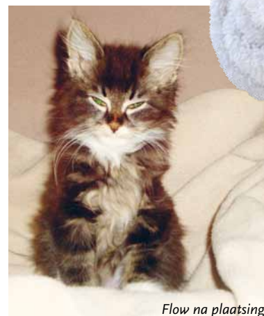
Flow na plaatsing