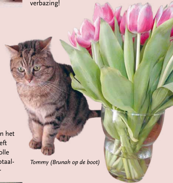
Tommy (Brunah op de boot)

Op de boot vielen de katten uit hun mandjes van verbazing!