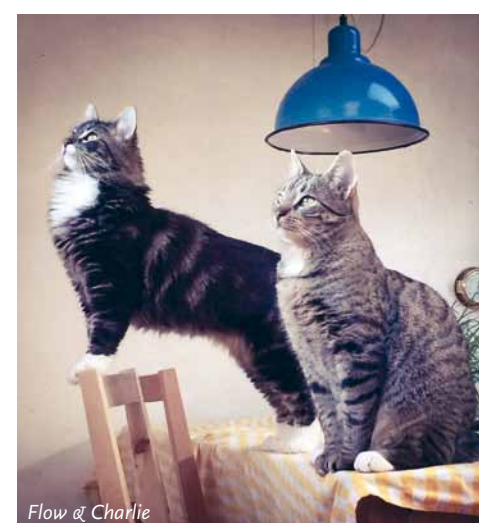
Flow & Charlie

Als ik ze soms bang was dat de stoeipartij te wild werd en ik ze uit elkaar haalde, dan sprong kleine Flow als eerste weer bovenop Charlie. Vanaf dat moment zijn het de dikste maatjes geworden en zijn het twee belhamels samen.