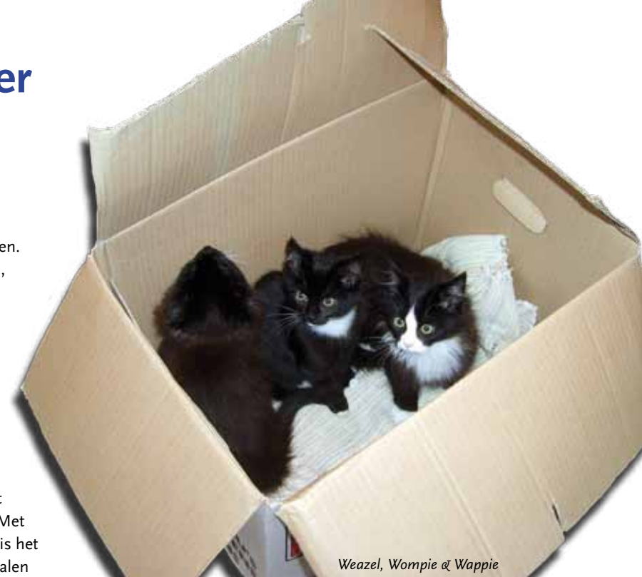
Weazel, Wompie & Wappie

ook al heeft u de kat al jaren. Hoe ging het met wennen, zijn bange katten lang bang gebleven of nog steeds bang, waren er problemen met zindelijkheid, zijn vermiste katten terug gevonden. Over alles kunt u ons voor ons krantje vertellen. Een kort verhaal is prima, het hoeft geen volle pagina te zijn. Met een (duidelijke) foto erbij is het nog beter. U kunt uw verhalen sturen naar Poezenboot@zonnet.nl onder vermelding van: tekst krantje .