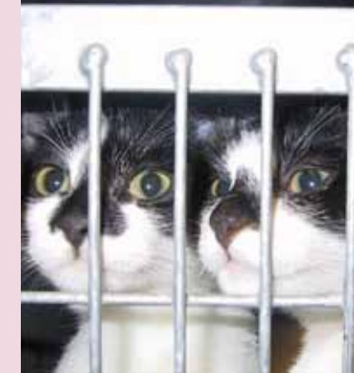
Wattebolletje & Zeepe

hier tegen zullen zijn. Niet iedereen wil een huisdier, of heeft daar iets mee.