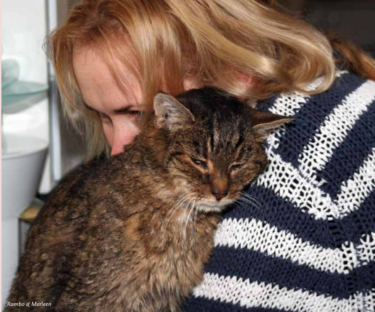
Rambo & Marleen

Het is echt een knuffel kont die Deugniet !! :D Huiswerk maken is soms nog moeilijk met zo'n schatje op je schoot !! :P Het is ook heel erg grappig hoe hij soms zit te spelen !!! Hij kan een half uur zoet zijn met een simpel balletje of bolletje wol of zelfs met een lege chips zak!! >>>>> ZoOo schattig !! Met ons spelen vindt hij ook erg leuk met zo'n stok met een touwtje er aan, daar rent hij dan achter aan, heel erg grappig !! :D Ik zou nu echt niet meer zonder hem kunnen !! Ik ben een paar weken geleden een weekje met mijn vader naar New York geweest en degene die ik het meest had gemist na zo'n week was..... je raad het al Deugniet natuurlijk !! :P Toen ik hem weer zag kon ik hem niet meer loslaten !! Het is ook zo'n Poepiie !! :P Ook met vreemde mensen gaat het goed, in het begin zijn ze nog wel even spannend, eerst even kijken en ruiken, maar daarna krijgen de meeste gelijk een kopje !! :D Hij is ook al helemaal dol op mijn vader die hij bijna elke week wel ziet!! Ook mijn beste vriendin die hier bijna elke dag komt vindt hij heel erg lief!! :P Ik ga het nog een keer zeggen hoor : P: We zijn echt heeeeeeeneeel erg blij met hem !! We hebben het echt getroffen!! : D Maar ik ga stoppen want ik ga mijn schatje weer knuffelen !! :D Heel veel Kussiiiees Marijn !!!