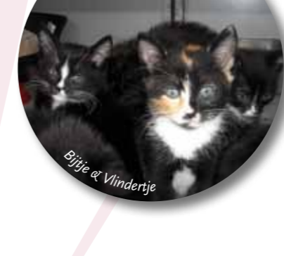
Bijje & Vlindertje