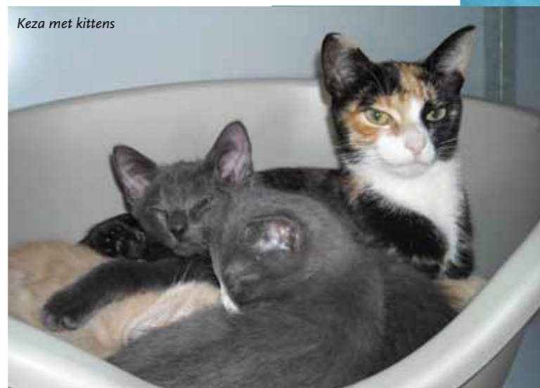
Keza met kittens