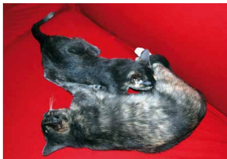
'Van zogen wordt je sterker'. Dit kitten van 4,5 maanden benut maar wat graag de mogelijkheid om nog bij haar moeder te zogen.

De eerste weken mogen kittens ongelimiteerd bij de moederpoes drinken, maar daarna bepaalt zij wanneer een kitten mag drinken. Zo kan een kitten dat wil drinken van een koude kermis thuiskomen. Moederpoes kan een kitten namelijk flink op zijn plaats zetten als zij niet wil dat er gedronken wordt. Hierdoor leert een kitten om te gaan met frustraties en dat is een wijze les voor de rest van zijn leven. Als een poes een kitten weigert, dan betekent dat dus niet dat het poesje verstoten wordt.