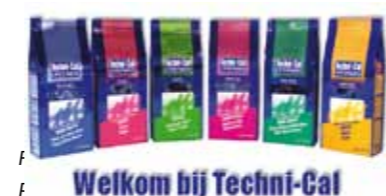
Welkom bij Techni-Cal

Wilt u meer weten vraag uw dieren speciaal zaak of kijk op de Techni-Cal site: www.techni-cal.nl We willen de firma v. Ree (importeur van Techni-Cal) dan ook bedanken voor het ter beschikking stellen van het nodige kattenvoer.