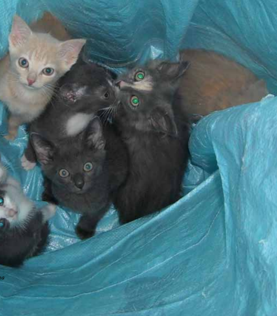
7 Kittens van Keza en Kima