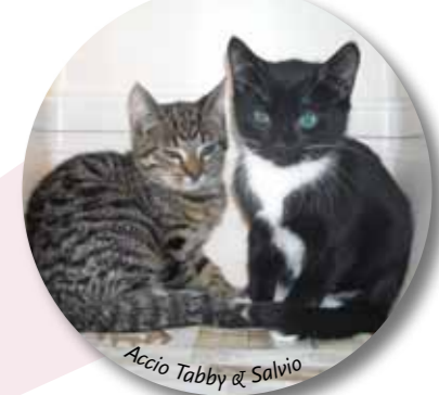
Accio Tabby & Salvio