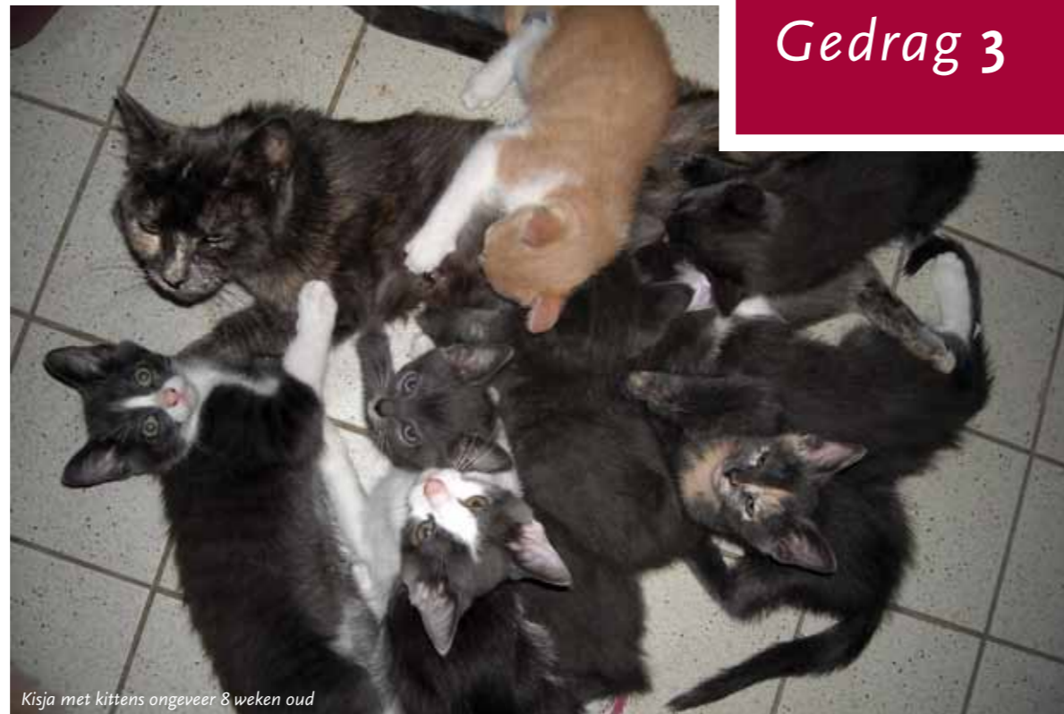
Kisja met kittens ongeveer 8 weken oud

Als een kitten wordt geboren, zal hij net als andere zoogdieren direct bij mama gaan drinken. De moedermelk van een kat is voedszaam en precies afgestemd op de behoeften van een kitten. Ook worden kittens er rustig van als ze bij mama drinken.