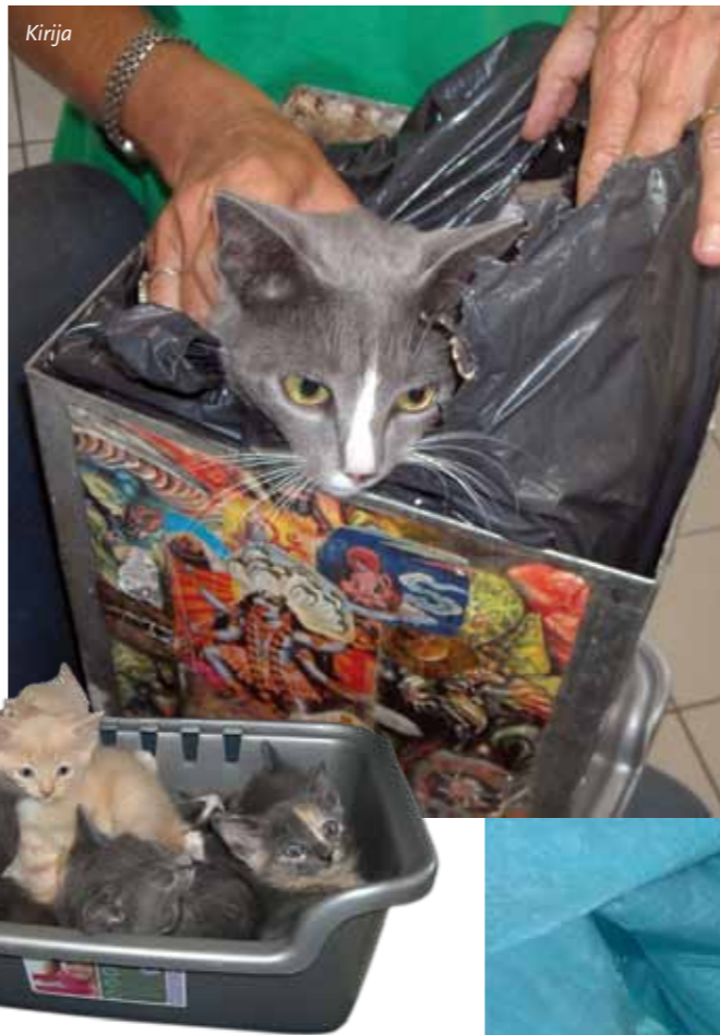
10 kittens van Kirija en Kisja

10 Kittens zaten in een soort plastic bakje met een deksel erop. Ongeveer een week later kwamen de andere 2 moeders in een grote katten-draagmand, die ze inmiddels van ons had meegekregen, maar de 7 kittens kwamen in een grote plastic zak. Ze waren zeker niet "Hollands welvaren" en hadden nog geen wormtablet of inenting gekregen. De moeders waren mager, wat wil je met zoveel kittens. Maar echt slecht behandeld waren ze niet. Mevrouw wist niet meer welk kitten bij wie hoorde en hoe oud ze precies waren. Het was een heel karwei voor de dierenarts om alle moeders en kittens na te kijken en te behandelen. 2 moeders en 10 kittens heb ik mee naar huis genomen. Het was even een kattencrèche in huis. Maar allemaal lieve hummeltjes. We hebben alle 4 de moeders met een kitten geplaatst, sommige broertjes en zusjes samen en sommige kittens bij mensen die al een kat hebben. We plaatsen kittens niet alleen, ze hebben een maatje nodig. Net als mensen zijn katten sociale dieren, ze hebben contact nodig met soortgenoten. We zijn blij dat ze allemaal zo goed terecht gekomen zijn bij liefdevolle mensen.