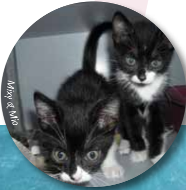
Ming & Mio