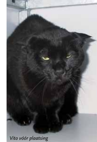
Vito vóór plaatsing