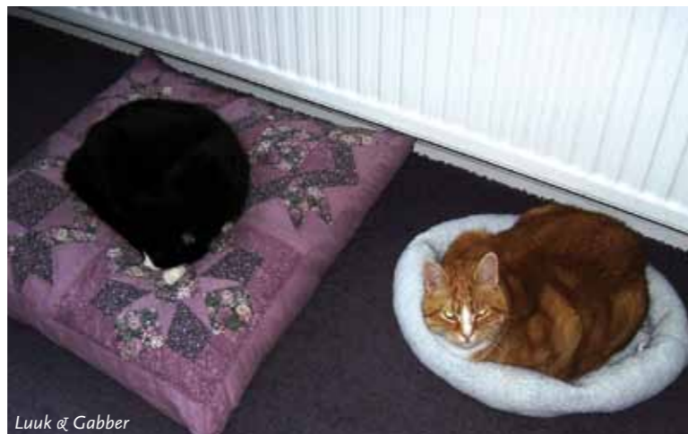
Luuk @ Gabber

Poezenboot-kater Luuk kwam in 2006 bij mij wonen. Door hem ben ik vrijwilligster geworden bij de Poezenboot en van beide beslissingen heb ik geen dag spijt!