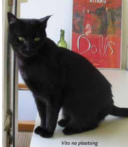
Vito na plaatsing

Ook na een werkdag kan ik rekenen op een uurtje gemiauw om duidelijk te maken dat het niet op prijs gesteld wordt als ik er niet ben om hem aandacht te geven, maar gelukkig wordt dat al snel goedgepraakt op de bank met Vito op schoot (deze kat kan met foto in het woordenboek naast het woord: schootkat). Ondanks dat alles zou ik niet meer