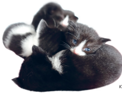
Kittens van Sera

Zoals u weet hebben we katten die u financieel kunt adopteren. Ze blijven dan op de boot en u steunt ze met een zelf gekozen bedrag. Dat zijn de 'loslopers', zoals wij ze noemen. Loslopers zijn niet de 'normale' huiskatten maar zijn katten die van buiten komen en amper met mensen in aanraking zijn geweest. Ze vinden ons dus super eng en kunnen daardoor agressief of extreem angstig reageren. Aanraken kun je ze sowieso niet. Als dat het geval is dan gaan ze meestal 'los' op de boot en is het afwachten hoe ze reageren. Sommige