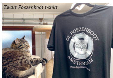
Zwart Poezenboot t-shirt

katten gaan ons dan gaandeweg steeds meer vertrouwen. De eerste keer dat je zo'n soort kat kan aanraken is prachtig maar kan heel lang duren; maanden, jaren en soms nooit. Maar als blijkt dat het toch zo goed gaat dan zit de kans erin, al hangt dat van een aantal factoren af, dat we gaan kijken naar super geschikte mensen en uiteindelijk de kat gaan plaatsen met een beetje pijn in ons hart! En dat is net gebeurd met Does en Riff. Phoe en die missen we nu! Maar als de berichten uit hun nieuwe thuis goed zijn, dan slijt de pijn en zijn we alleen maar super blij voor de katten. En hopen we dat de financiële adoptieouders weer een andere kat willen helpen/steunen.