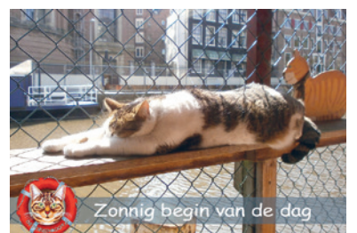
Zonnig begin van de dag