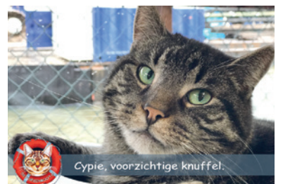
Cypie, voorzichtige knuffel.