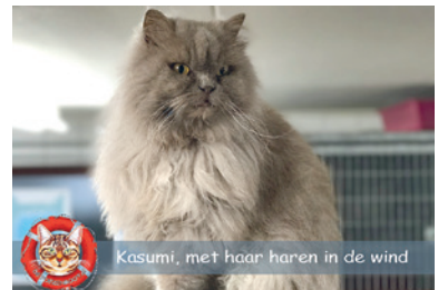
Kasumi, met haar haren in de wind