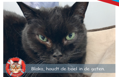
Blaka, houdt de boel in de gaten.

En dan halen wij u uit ons adressenbestand.