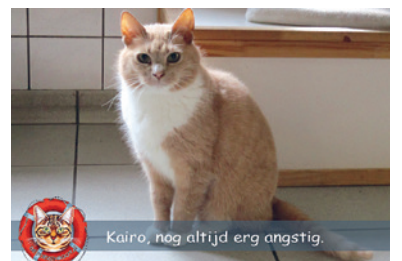
Kairo, nog altijd erg angstig.