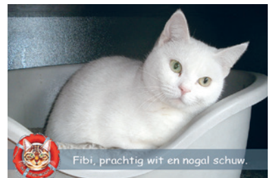
Fibi, prachtig wit en nogal schuw.