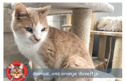
Samus, ons oranje duveltje.