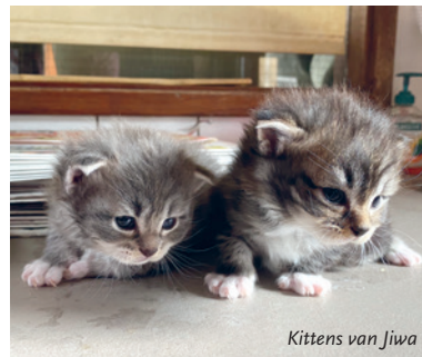
Kittens van Jiwa

We kunnen in deze situaties helpen. Laat het ons weten als het aantal katten u boven het hoofd groeit of als u mensen kent die op deze manier in de problemen komen of al zitten.