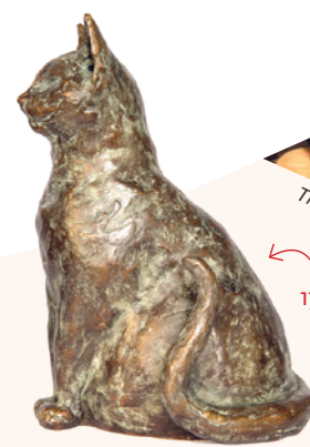
Timmie & Tommie 17 cm.

Heb je een idee of een vraag, neem vrijblijvend contact met mij op.