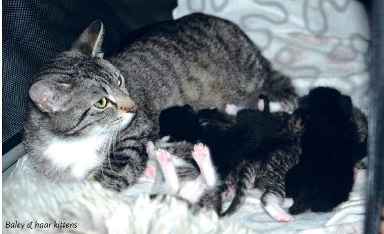
Baley & haar kittens