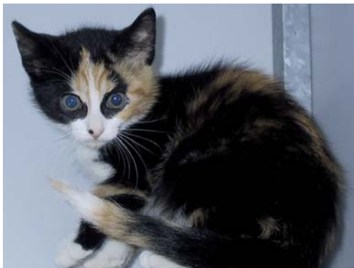
Esprite (ook al geplaatst)

Dat geeft dan veel stress wat ook niet goed voor hem is, we zijn overgegaan op de injecties, wat op zich veel rustiger kan gaan. Ook die kuur is afgerond en nu afwachten hoe hij reageert nu hij geen medicijnen meer krijgt. De dierenarts denkt dat het chronisch kan zijn, wat voor hem inhoud