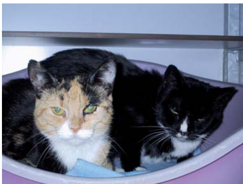
Roxy en Vanz (nog niet geplaatst)

dat hij soms periodes heeft dat hij niest, zelf heeft hij daar niet echt last van: hij eet, drinkt en doet van alles. We hopen heel erg dat er toch iemand is die zich over hem of over hem en Roxy wil ontfermen. Want inmiddels zijn ze aardig bijgetrokken. En als laatste Replay, een mooi blauw wit tenger erg angstig poesje. Ik hoop heel, heel, erg dat er geweldige mensen komen die haar willen opnemen, haar met engelen geduld weer wat vertrouwen in de mensen geven.